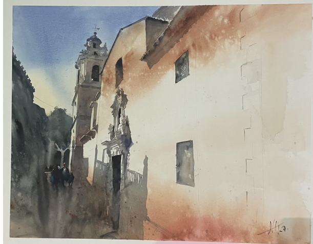
Iglesia · Acuarela sobre papel