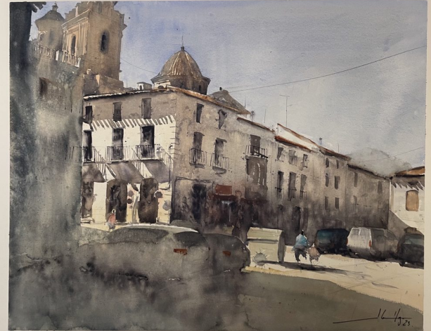
Plaza con torre · Acuarela sobre papel