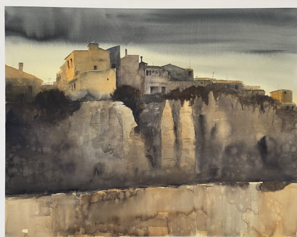
Pueblo sobre roca · Acuarela sobre papel