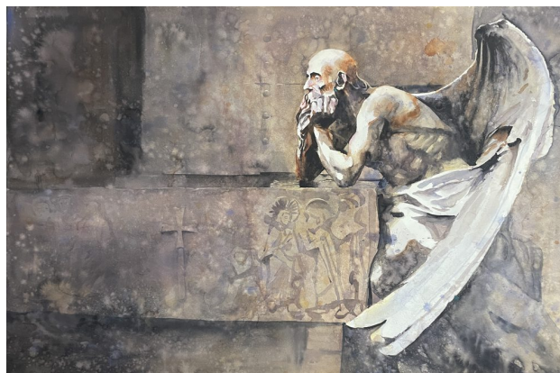
Figuras en movimiento · Acuarela sobre papel