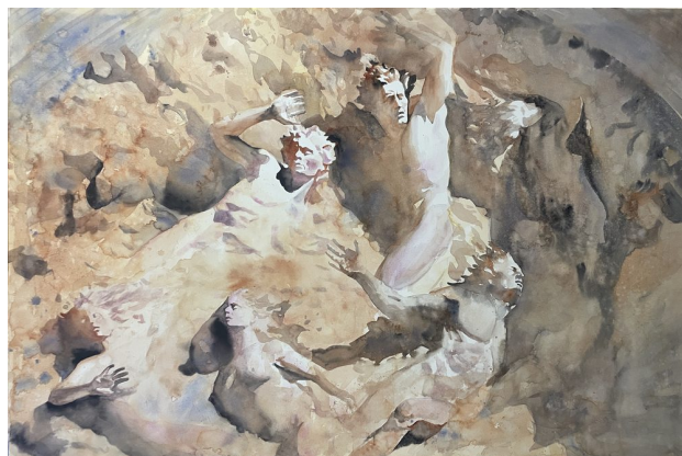
Figura con calavera · Acuarela sobre papel