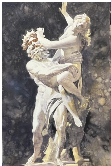
Hércules · Acuarela sobre papel