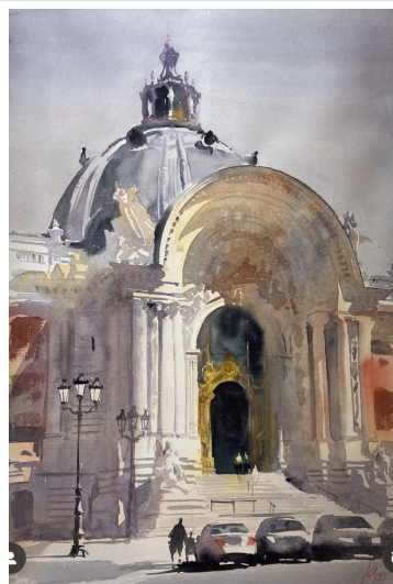
Cúpula, París · Acuarela sobre papel