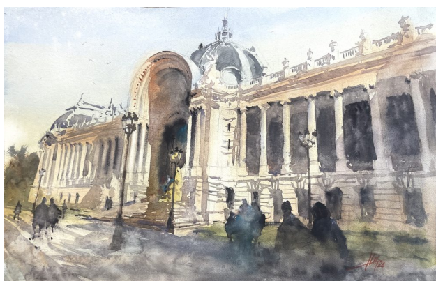
Petit Palais, París · Acuarela sobre papel