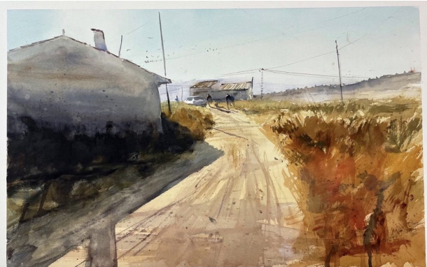
Camino · Acuarela sobre papel