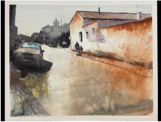
Calle con personajes · Acuarela sobre papel