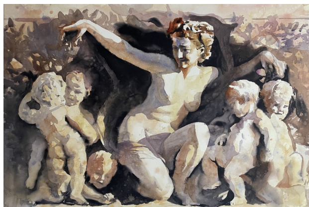
Figuras clásicas II · Acuarela sobre papel