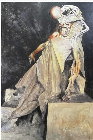
Figura con rosas · Acuarela sobre papel