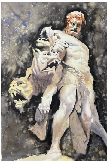
Figuras clásicas I · Acuarela sobre papel